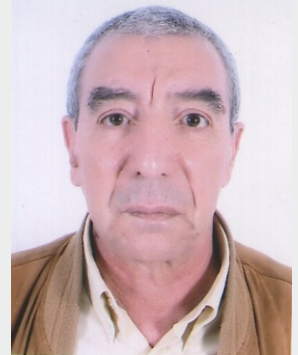
Par Pr. Bachir REDJEL Rédacteur en chef de la revue Synthèse